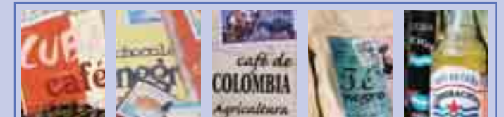
Alguns fets que cal saber

Dins la línia d'informació al consumidor i de foment del consum responsable, hem preparat una exposició i una conferència per a conèixer millor la situació dels productors agraris del tercer món, les condicions internacionals que els mantenen en situacions de pobresa i la contribució individual que cadascun de nosaltres pot fer en cada acte de consum. El consum solidari també és consum responsable.