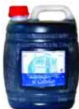
El Codolar Criança 4,95 € garrafa de 2 l.