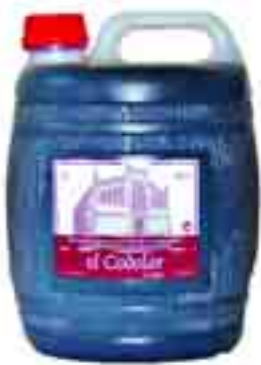
El Codolar Jove 3,95 € garrafa de 2 l.