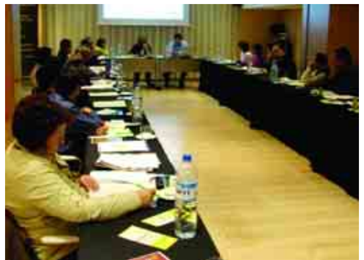
La Sala d'Actes de Cooperativa 70 durant la sessió de treball.