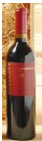
Vi negre Costers del Gravet D.O. Montsant Coop. Capçanes 11,50 euros l'ampolla