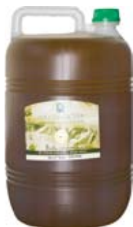
Oli verge extra Denominació d'Origen Les Garrigues, elaborat per la Cooperativa d'Alcanó. 23 Euros garrafa de 5 l.

Productes d'alimentació: Cacaos i xocolates, cafès i infusions, pasta, mel, mermelades i molts productes més de gran qualitat. Productes d'artesanía: decoració, bijuteria, bosses i motxilles, moda, complements i decoració.